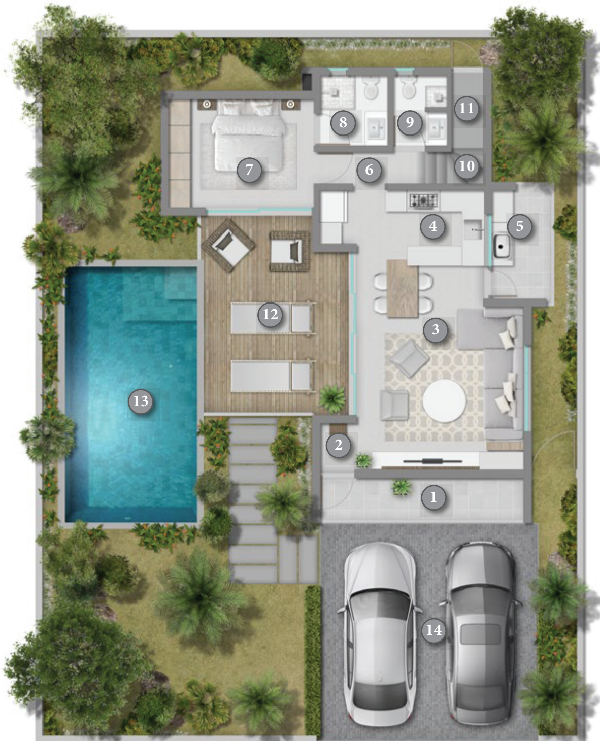
Ground Floor / Rez de Chaussée